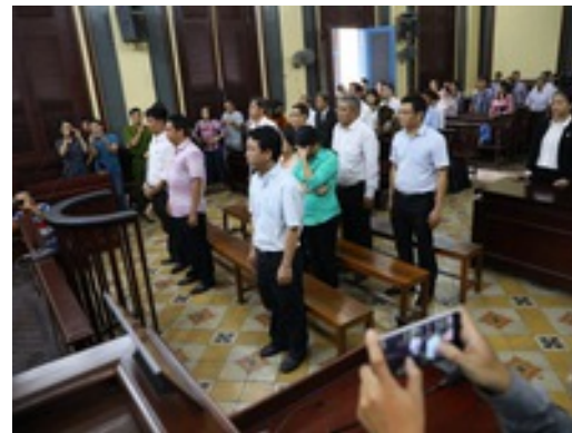
Cục quản lý dược sai thế nào khi cấp phép VN Pharma nhập lậu?