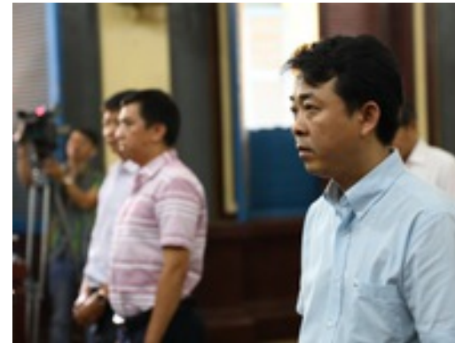
Viện kiểm sát cấp cao rút hồ sơ vụ VN Pharma để xem xét