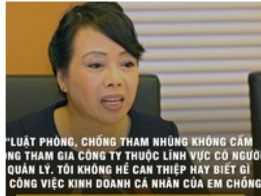
Bộ trưởng Y tế giải thích việc em chồng làm lãnh đạo VN Pharma